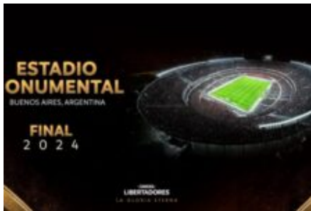
Pacotes para assistir a final da libertadores em Buenos Aires já estão disponíveis a partir de US$1,2 mil 24/10/2024