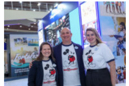
Iniciativa inédita no BTM, crescimento do mercado brasileiro e D23: Alexander Haim comenta novidades da Disney 24/10/2024